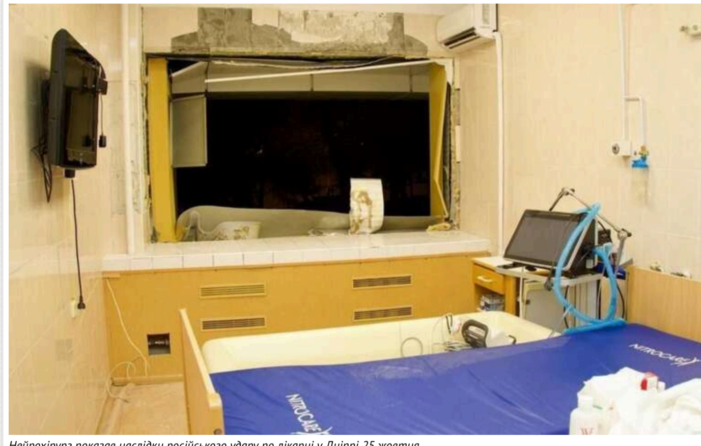
Нейрохірург показав наслідки російського удару по лікарні у Дніпрі 25 жовтня

Увечері 25 жовтня російська терористична армія завдала серії ракетних ударів по Дніпру.