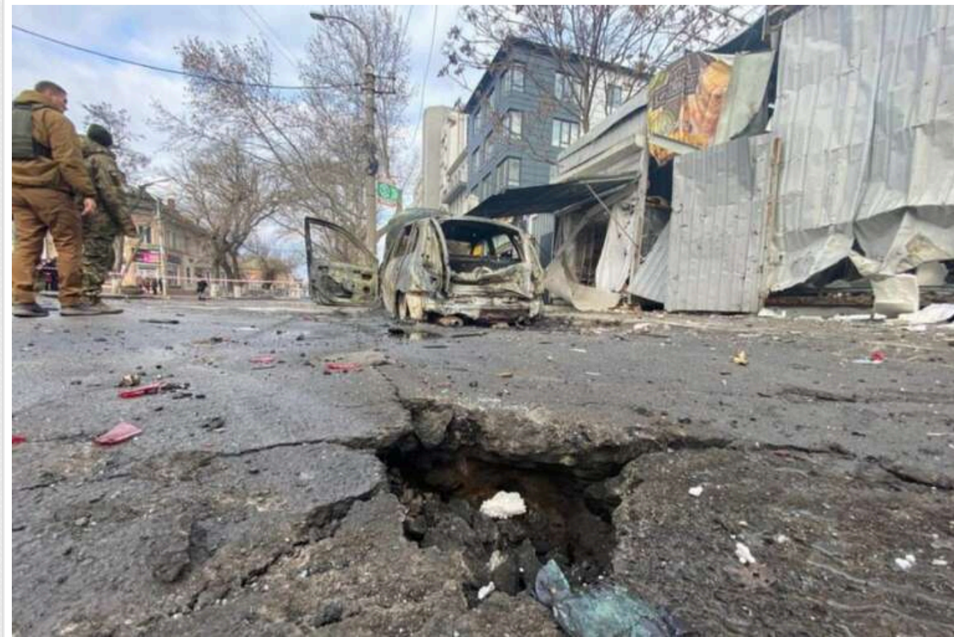
Окупанти обстріляли Центральний район Херсона: є загиблий та постраждалий

Російські війська завдали удару по Центральному району Херсона, є загиблий та поранений.