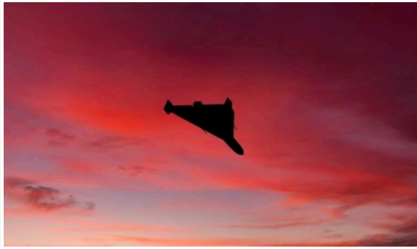
Уночі в Білорусь залетіли як мінімум два російські БПЛА, — Гаюн

У ніч на неділю, 27 жовтня, до Білорусі з України залетіли щонайменше 2 російські «шахеда», один з яких зник.