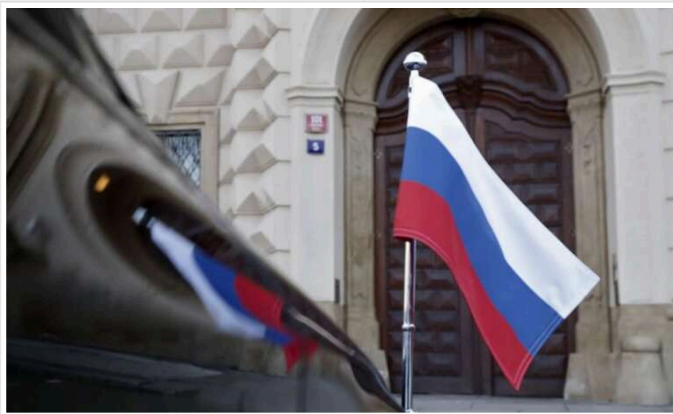
Канада скоротила кількість дипломатів у Росії до мінімуму

Кількість дипломатичного персоналу Канади в Росії зменшилася до мінімально допустимого рівня.