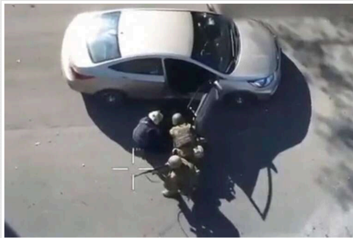
Розстріл мешканців Селидового: в Офісі генпрокурора розпочали розслідування

У місті Селидове в Донецькій області окупанти вчинили розстріл місцевих жителів. Прокурори розпочали розслідування.