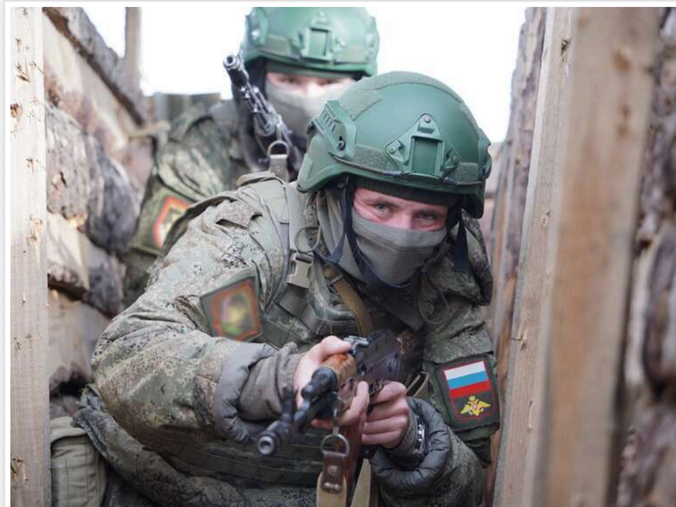
На Вугледарському напрямку за місяць окупанти просунулися на 10 км, - DeepState

Лише на 10 км за місяць російським військам вдалося просунутися на Вугледарському напрямку.