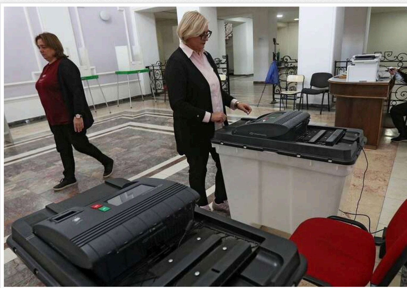
Вибори в Грузії: виборці голосували за допомогою спеціальних пристроїв, схожих на принтери

На виборах у парламенті Грузії виборці голосували за використанням спеціальних пристроїв, схожих на принтери.