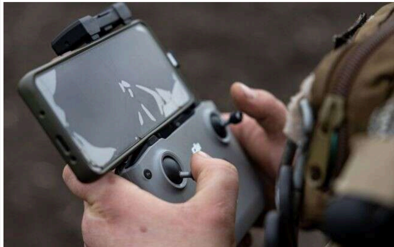
Неподалік Горлівки українські військові знищили дві російські САУ "Пион"

Українські військові знищили дві САУ "Пион" неподалік Горлівки. Окуповане місто розташоване за 25 км від фронту й вважається глибоким тилом росіян.