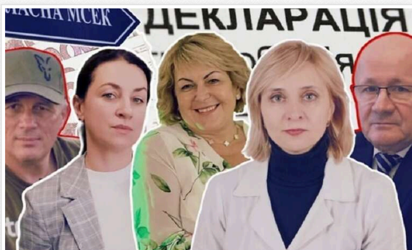
Оприлюдили рейтинг декларацій голів обласних МСЕК: 18 із 25 керівників виявилися мільйонерами