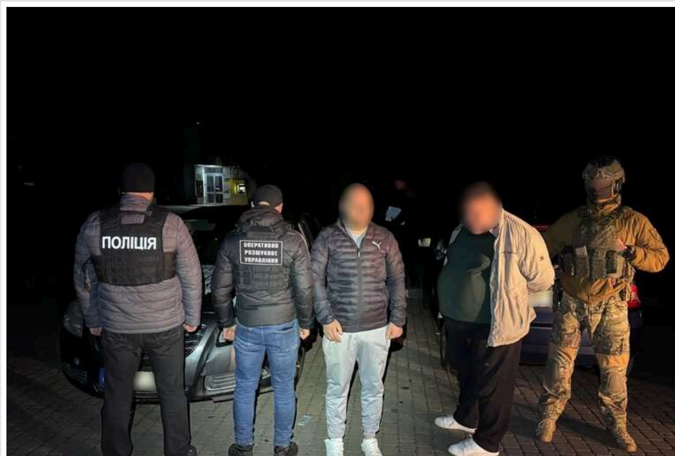
На Закарпатті викрили нову схему для ухиялянтів: підсаджували в потяг на ходу

На Закарпатті правоохоронці та прикордонники викрили нову схему перетину державного кордону військовозобов'язаними. Організатори намагалися "підсадити" ухиялянта в поїзд, що прямував до Ужгороду.