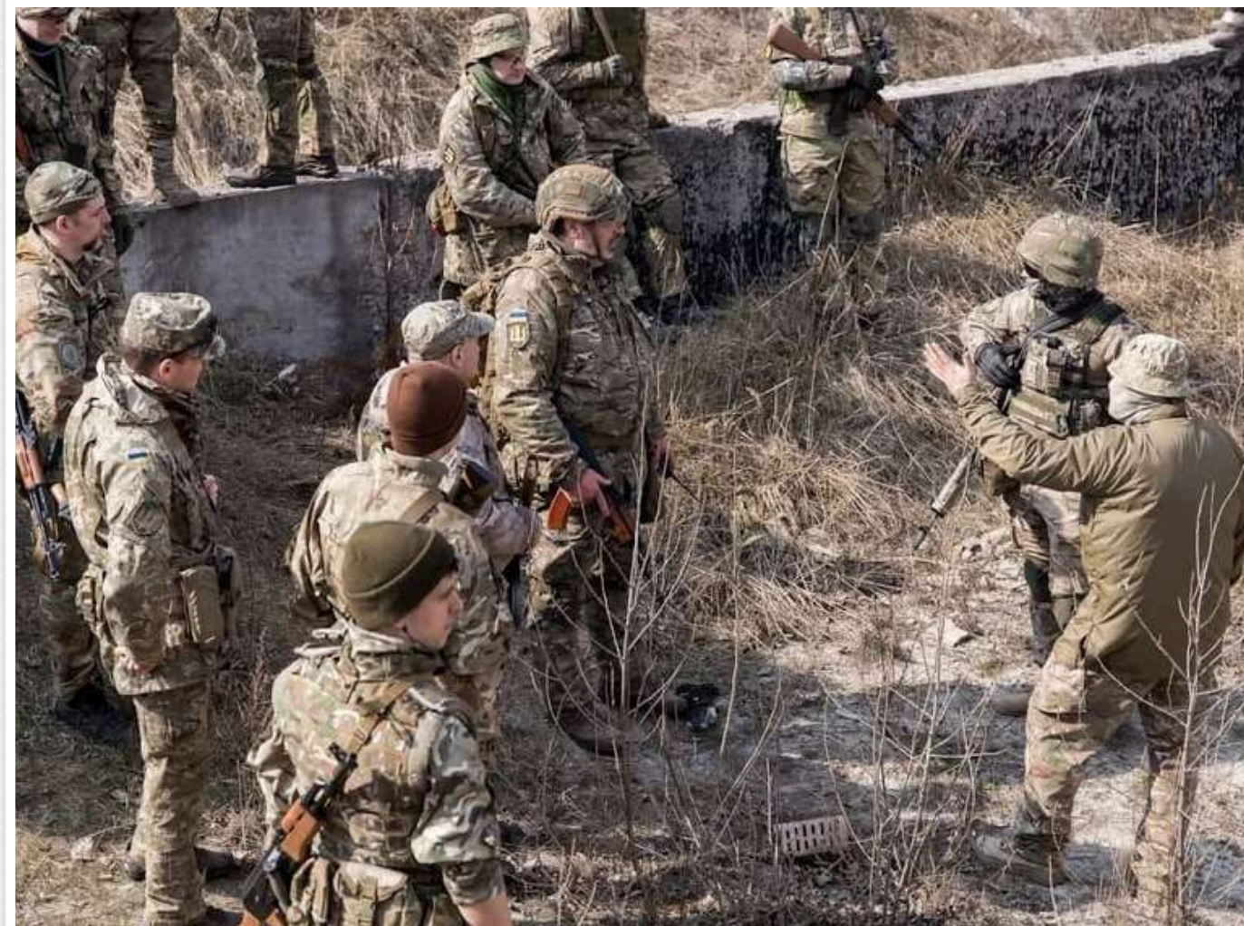
ISW: ЗСУ провели посилену механізовану атаку на захід від виступу на Курщині, Путін готується задіяти північнокорейських солдатів

26 жовтня Збройні сили України здійснили посилену механізовану атаку на російські позиції в Глушковському районі Курської області РФ. Російські війська також намагалися відновити контроль над певними позиціями, але загалом лінія фронту на цій території не зазнала змін протягом доби.