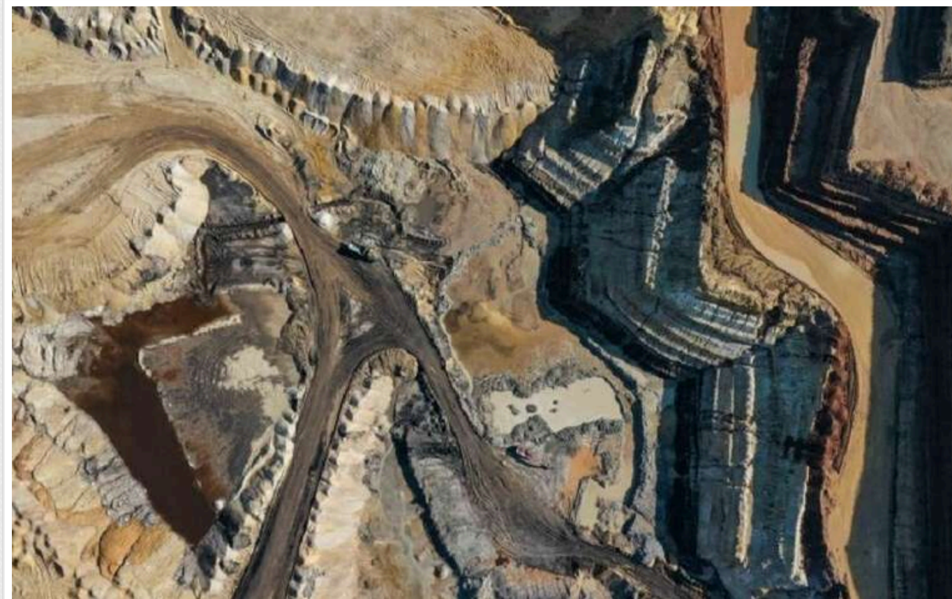
Пинязевицькі й Коростенське родовища гранітів поки залишилися під контролем "Новел Пром"