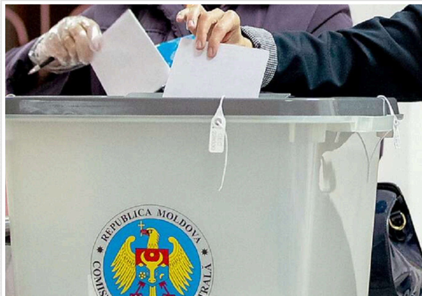
У Молдові поліція склала понад 300 протоколів про підкуп виборців

Станом на 25 жовтня правоохоронні органи Молдови зареєстрували 489 випадків підкупу виборців на президентських виборах та референдумі. За цими даними поліція склала 341 протокол.