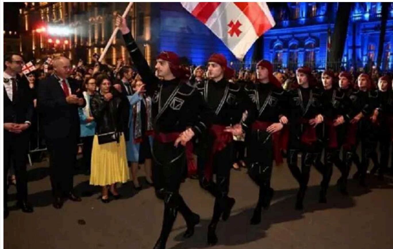
Парламентські вибори в Грузії: опозиція відмовилася визнати результати

У Грузії дві партії заявили про невизнання результатів виборів до парламенту країни.