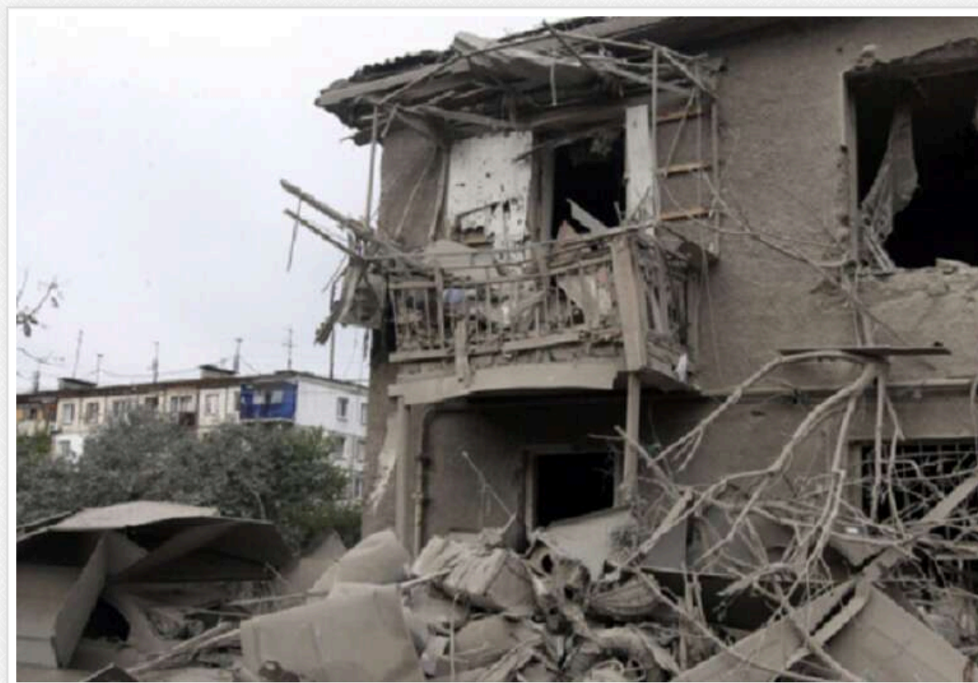
У Дніпрі оголосили день жалоби за загиблими від ракетного удару

27 жовтня у Дніпрі оголошено днем жалоби за загиблими через ракетну атаку військ РФ.