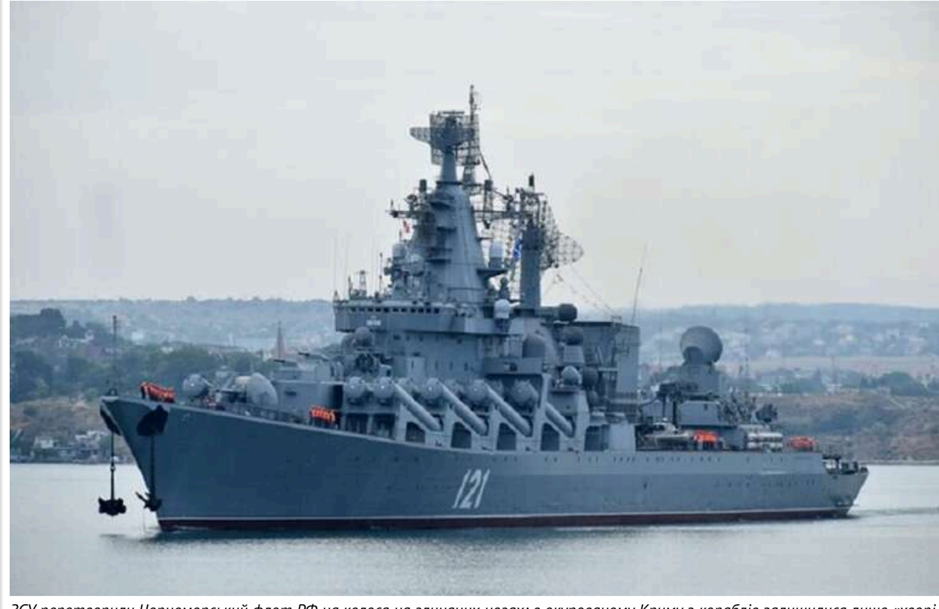
ЗСУ перетворили Чорноморський флот РФ на колоса на глиняних ногах: в окупованому Криму з кораблів залишилися лише «хворі та старі»

У Військово-морських силах України заявляють, що російський флот більше не може впливати на перебіг бойових дій в Україні, а його логістику в Азово-Чорноморському регіоні повністю порушено. Що відбувається, розбиралися у виданні Крим.Реалі.