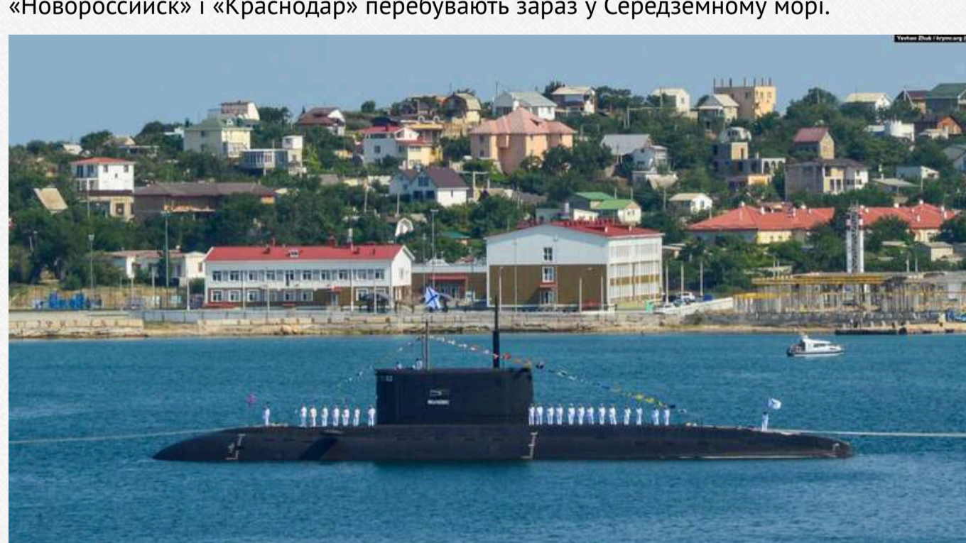
Підводний човен «Новоросійськ» Чорноморського флоту РФ під час військово-морського параду в Севастополі. Крим, архівне фото

Ще три підводні човни проєкту 636.3 «Варшавянка», носії КР «Калібр», пришвартовані в бухті Новоросійська. У складі ЧФ є шість таких підводних човнів, з яких підводний човен «Ростов-на-Дону» пошкоджений українським ракетним ударом 13 вересня 2023-го і, як згадувалося, стоїть у ремонті в Севастополі, а підводні човни «Новоросійськ» і «Краснодар» перебувають у Середземному морі.