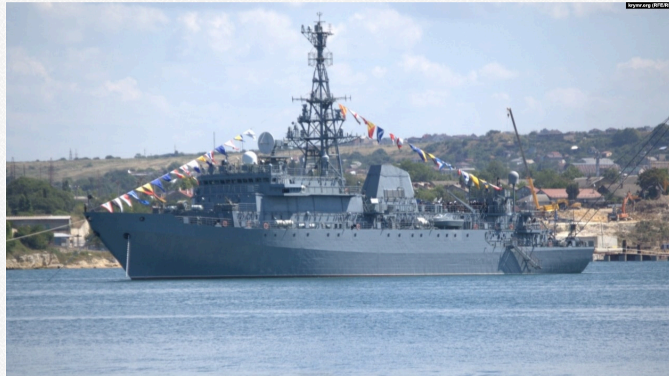
Розвідувальний корабель «Іван Хурс». Архівне фото

Моніторинговий канал «Крымский ветер» повідомляє, які кораблі залишилися у Севастопольських бухтах. «Це ВДК пр. 1171 «Тапир», два ВДК пр. 775 (їхні стані і бездальність після ударів ЗСУ невідомі – КР), розвідкорабель «Іван Хурс» (стан і бездальність після удару ЗСУ невідомі – КР), два або три міні тральщики, судна допоміжного флоту Патрулювання бухт здійснюють десантні катери проекту 02510 «БК-16» та патрульні катери проекту 03160 «Раттор», – зазначає паблік.