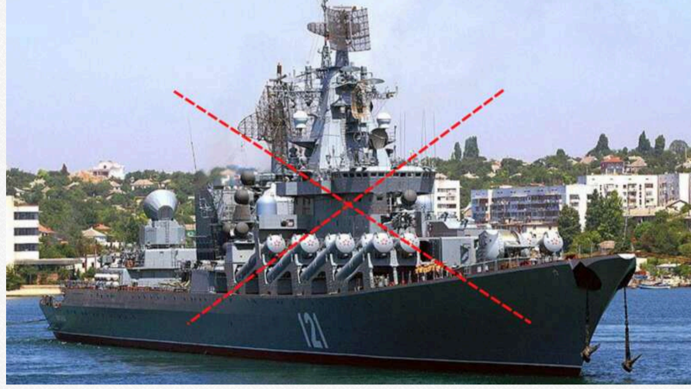
Фото, поширене в соймережах, на якому крейсер «Москва», флагман ЧФ Росії, після влучання в нього українських ракет. Квітень 2022 року

Раніше речник ВМС ЗС України заявляв, що російський флот більше не може впливати на перебіг бойових дій в Україні. Він зазначив, що «слабкість російського флоту підтверджують реальні бойові дії в Україні». За словами Плетенчука, Росія вважає себе «потужною морською державою», проте «вона все одно технологічно відстає від країн НАТО».