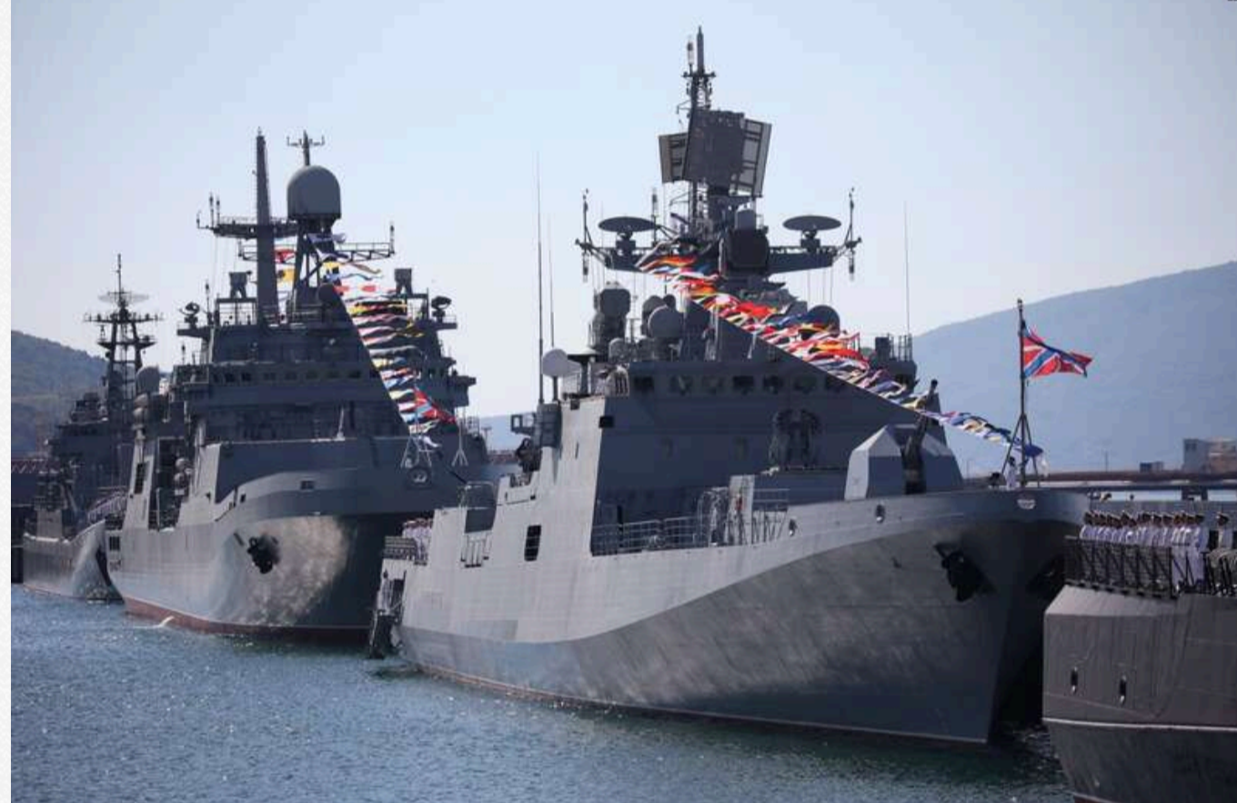
Кораблі Чорноморського флоту Росії беруть участь у святкуванні Дня ВМФ РФ у російському портовому місті Новоросійськ 30 липня 2023 року

OSINT-дослідник MT Anderson давно перестав публікувати супутникові знімки та відстежувати ситуацію з кораблями ЧФ РФ у Севастополі, хоча раніше це робив щонайменше раз на тиждень. Втім, знімки кораблів у Новоросійську аналітик публікував востаннє аж 16 вересня, понад два місяці тому. Тоді майже всі кораблі вийшли з Військової гавані Новоросійська у межах навчань.