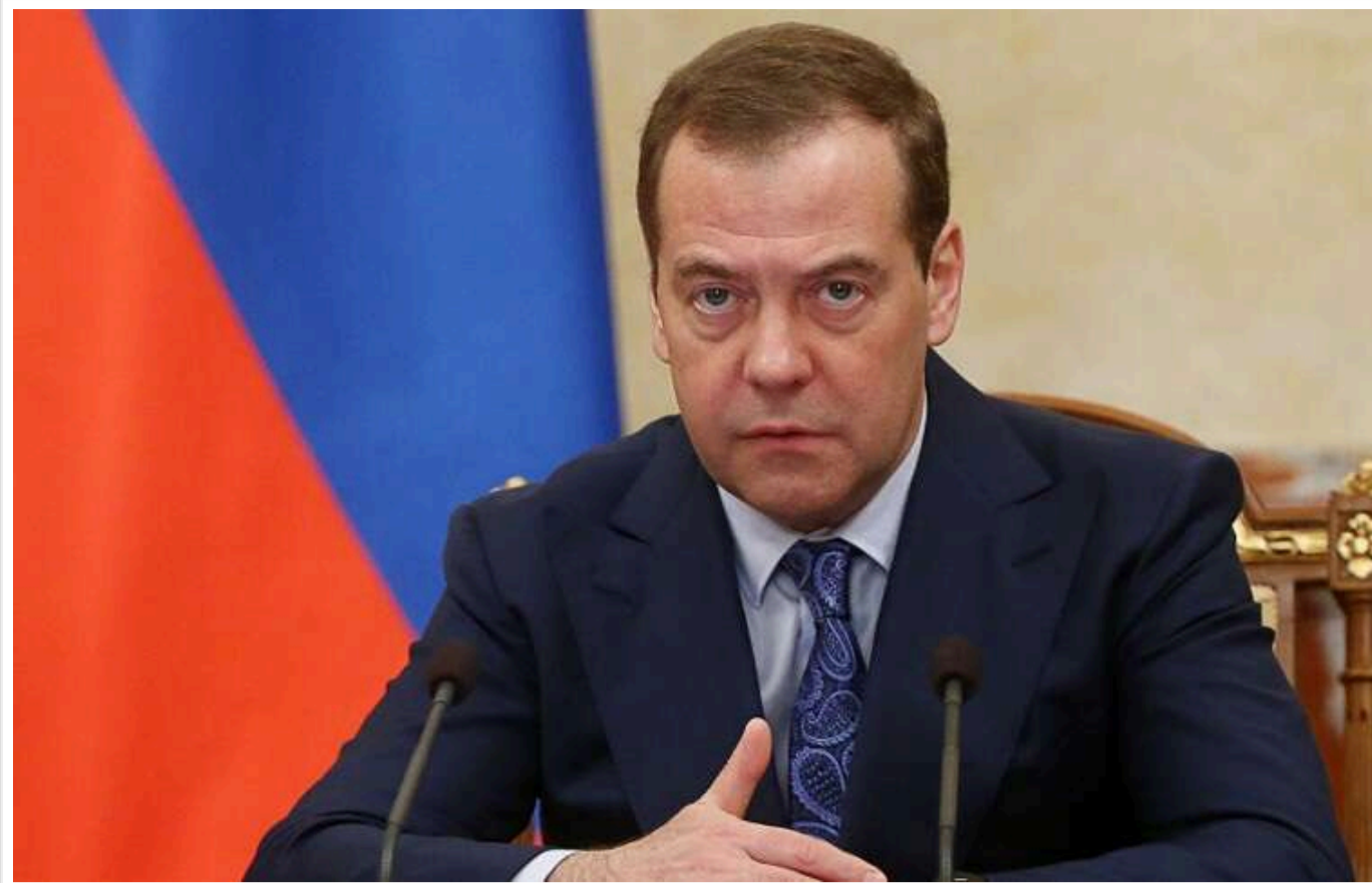
Медведєв погрожує завдати ударів по заводу Rheinmetall

Дмитро Медведєв пригрозив ударом по заводу Rheinmetall, який почав роботу в Україні.