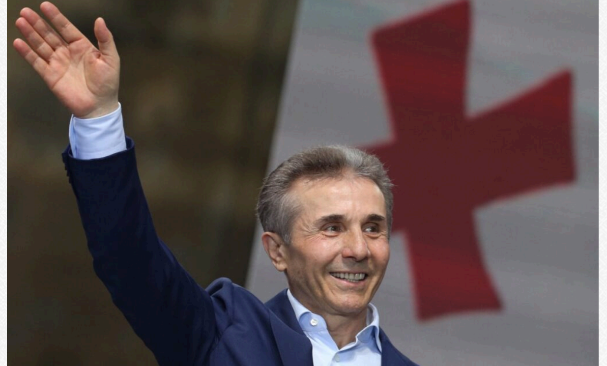
Бізіна Іванішвілі – грузинський олігарх, засновник партії «Грузинська мрія».

1 жовтня цього року «Грузинська мрія» побил рекорд. 12 років при владі – історичний максимум перебування партії при владі у Грузії. «Єдиний національний рух» на чолі з Міхелом Саакашвілі у 2012 році прийняв поразку і перейшов в опозицію. Бізіна Іванішвілі зіграв у цьому процесі ключову роль. Він – найбагатша людина Грузії (посідає за статками 624 місце у світі за даними Forbes , володіючи $4,9 млрд) і фактичний менеджер партії. Нижче кілька фактів з Forbes .