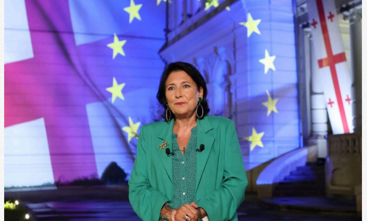
Президентка Грузії Саломе Зурабішвілі.

Президентка Саломе Зурабішвілі постійно закликає виборців до повної мобілізації. За її словами, народу не обов'язково думати про те, за яку опозиційну партію голосувати, слід зосередитися на ідеї європейського майбутнього держави.