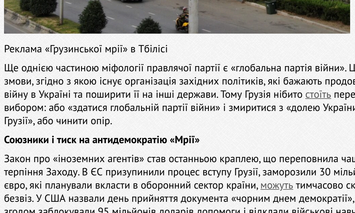
Реклама «Грузинської мрії» в Тбілісі

Президентка Саломе Зурабішвілі постійно закликає виборців до повної мобілізації. За її словами, народу не обов'язково думати про те, за яку опозиційну партію голосувати, слід зосередитися на ідеї європейського майбутнього держави.