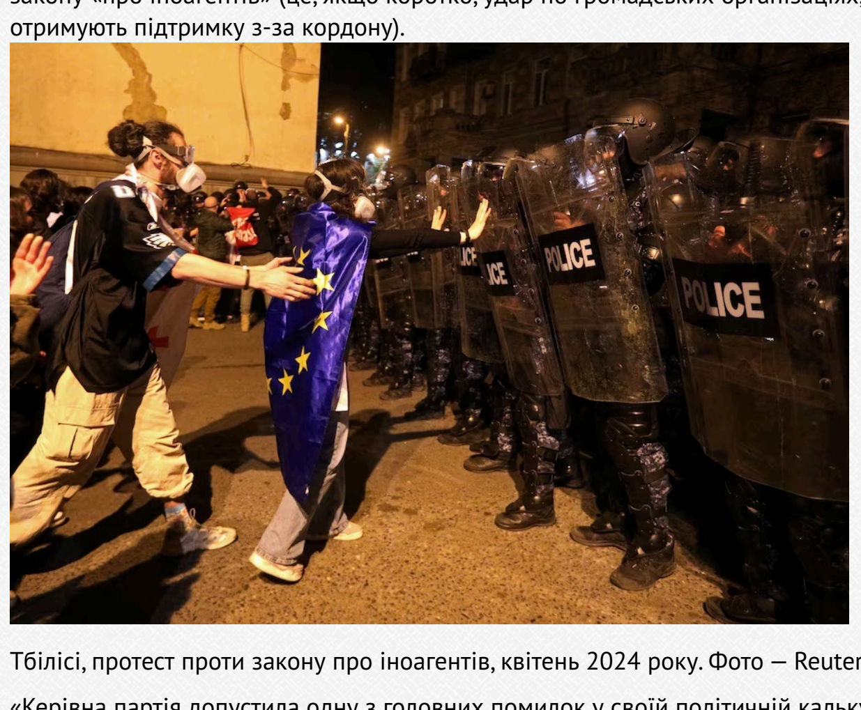
Тбілісі, протест проти закону про іноагенці, квітень 2024 року.

Ще крутіший розворот у бік Росії стався після початку повномасштабного вторгнення. Протяг 24 лютого 2022 року, коли РФ планувала напад на Україну, у Грузії почали з'являтися відверто проросійські партії. Потім – ухвалення на російській мові закону «про іноагенці» (це, якщо коротко, удар по громадських організаціях, які отримують підтримку з-за кордоном).