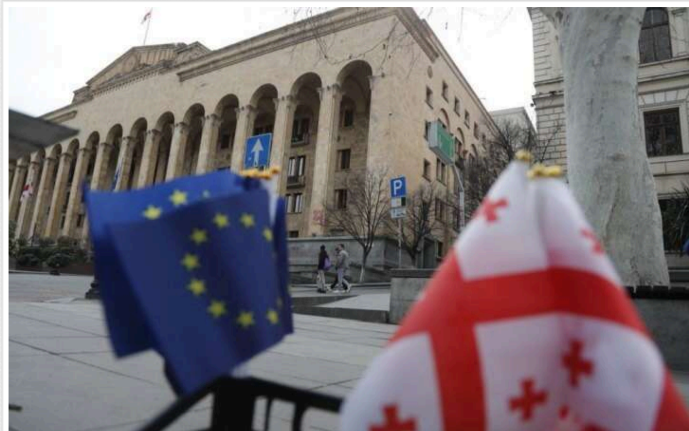
Вибори до грузинського парламенту: результати екзитполів суперечливі

У Грузії на цей момент закрилися всі виборчі дільниці. Екзитполи показують різні результати.