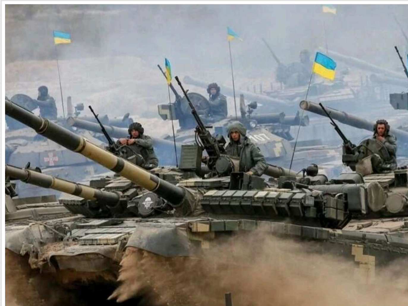
У Збройних Силах України заявили про ускладнення обстановки в Часовому Яру

Росіяни намагаються просуватися в місті Часів Яр Донецької області, використовуючи тактику малих піхотних груп, але бійці ЗСУ їх швидко нейтралізують.