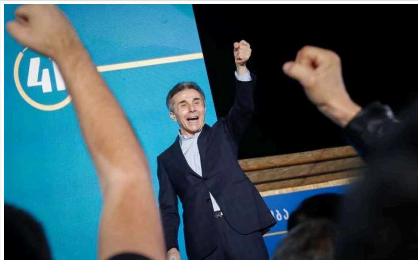
У проросійській "Грузинській мрії" вже заявили про нібито перемогу на виборах

Сьогодні, у суботу, 26 жовтня, у Грузії проходять парламентські вибори. У проросійській партії "Грузинська мрія" вже заявили про перемогу, хоча голосування ще не завершено.