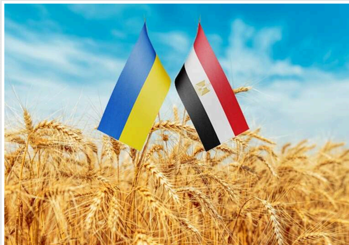
В МЗС заявили, що Україна налаштована на розвиток відносин з Єгиптом

Україна та Єгипет багато років залишаються надійними партнерами, підтримуючи значний обсяг торгівлі та активний політичний діалог. Завдання Києва - продовжити розвиток відносин з Єгиптом.