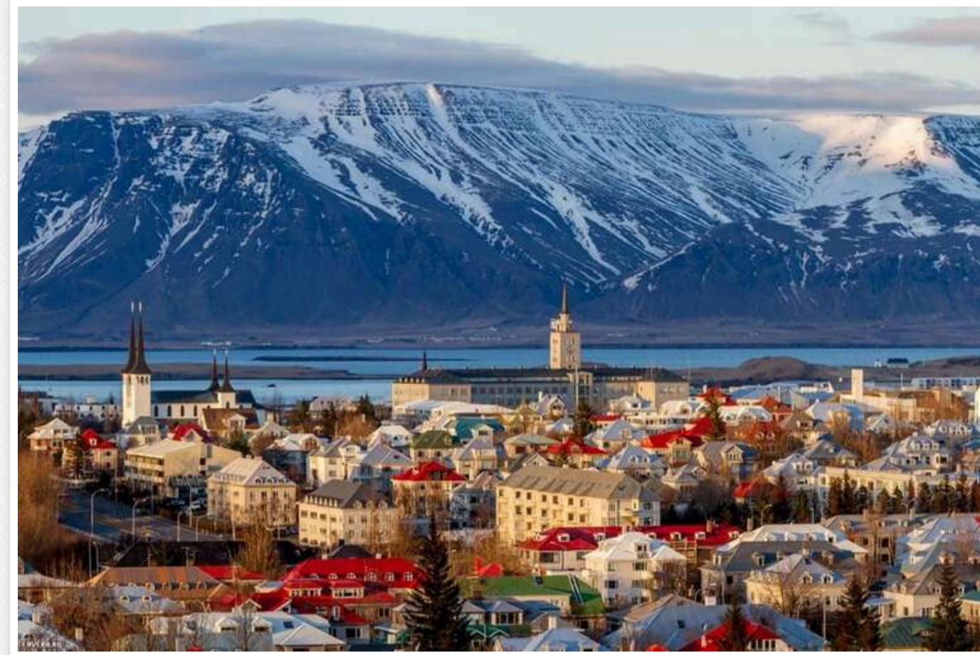
В Ісландії запровадили 4-денний робочий тиждень: стали однією з найбільш швидкозростаючих економік

Ісландія офіційно впроваджує чотириденний робочий тиждень - завдяки експерименту вона стала однією з економік, що найдинамічніше розвиваються в Європі.