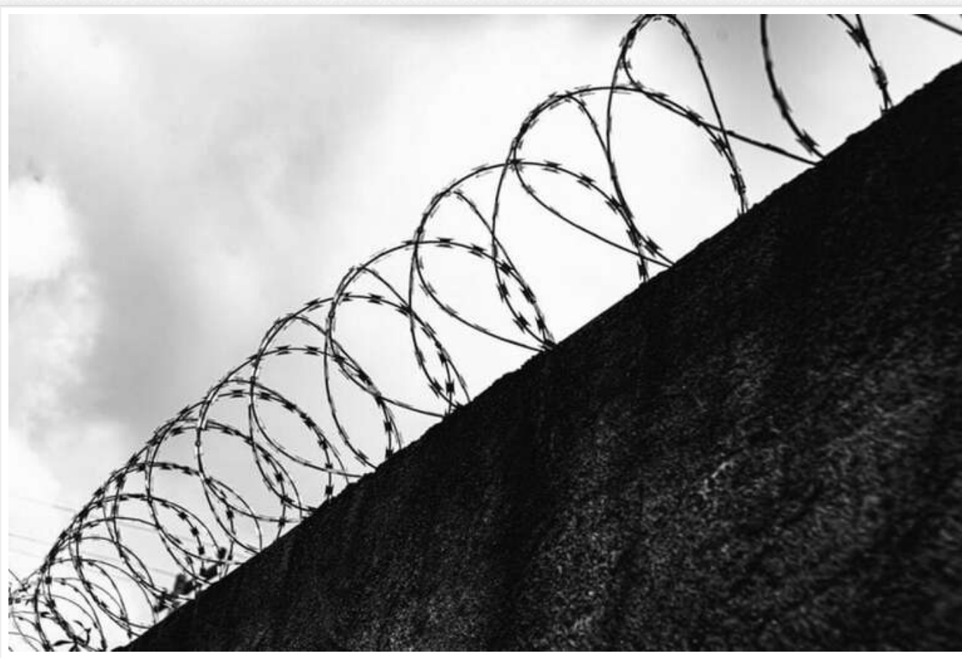
В Липецькій області РФ ув'язнені втекли з в'язниці через підкоп

З території виправної колонії втекли шість чоловіків. Місцева влада закликала жителів регіону зберігати спокій, щоб уникнути паніки, яка, як стверджується, може бути використана ЗСУ.