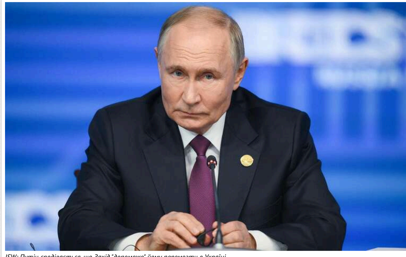
ISW: Путін сподівається, що Захід "допоможе" йому перемогти в Україні

Російський диктатор Володимир Путін сподівається на те, що Захід втомиться підтримувати Україну. На цьому базується його впевненість у тому, що Росія врешті-решт переможе у війні.