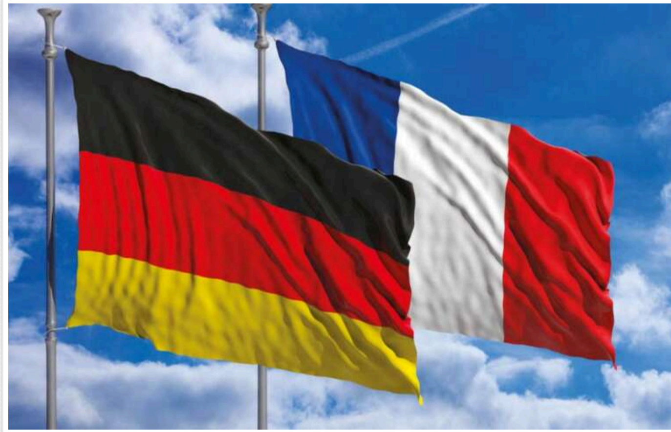
Франція і Німеччина скептичні щодо плану подолання вето Угорщини на допомогу Україні, - Bloomberg

Франція та Німеччина не схвалили пропозицію, спрямовану на обхід вето Угорщини, яке блокує виділення допомоги Україні на суму понад 6 мільярдів євро.