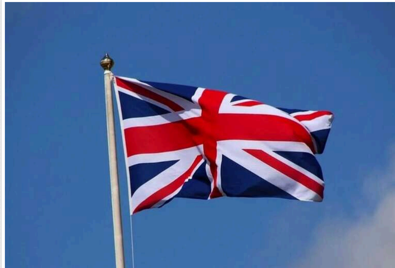
Велика Британія закликає Іран утриматися від відповіді на обстріл з боку Ізраїлю

Сполучене Королівство після ударів Ізраїлю по іранських військових об'єктах закликає "всі сторони проявляти стриманість".