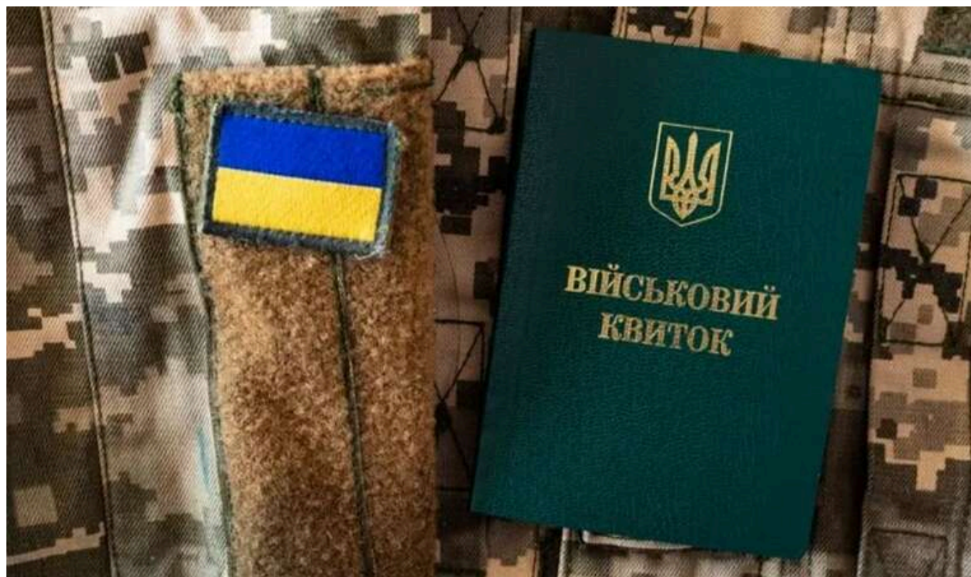
Кабмін частково відновив бронювання від мобілізації в Україні

Уряд повідомляє, що працівники, які отримали статус заброньованих до 31 травня 2024 року, зможуть продовжити термін свого бронювання.