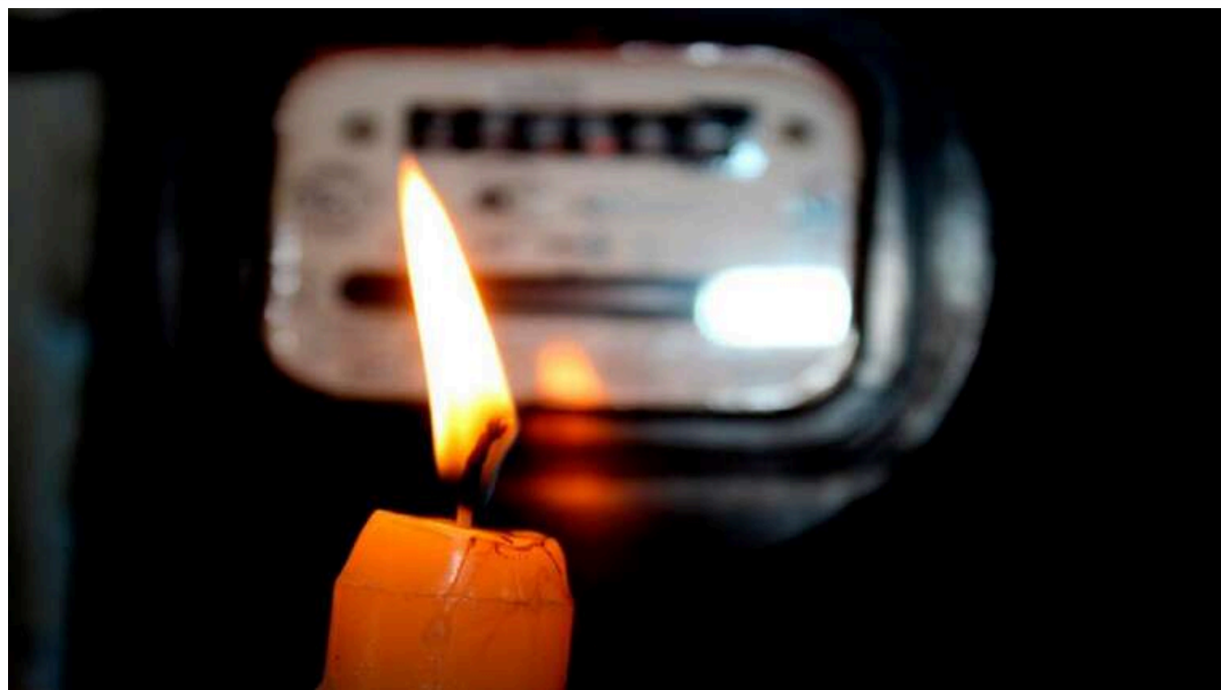
У Хмельницькому після атаки ворога зникло світло

У Хмельницькому зникло електропостачання через атаку 26 жовтня. Частково знеструмлені деякі населені пункти Хмельницького району.