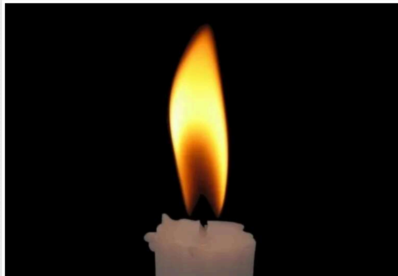
На Харківщині загинув російський доброволець «Леший», який боровся за незалежність України

У бою на Харківщині загинув російський доброволець з позивним "Леший". Він отримав смертельні поранення, коли кинувся на допомогу пораненому побратиму.