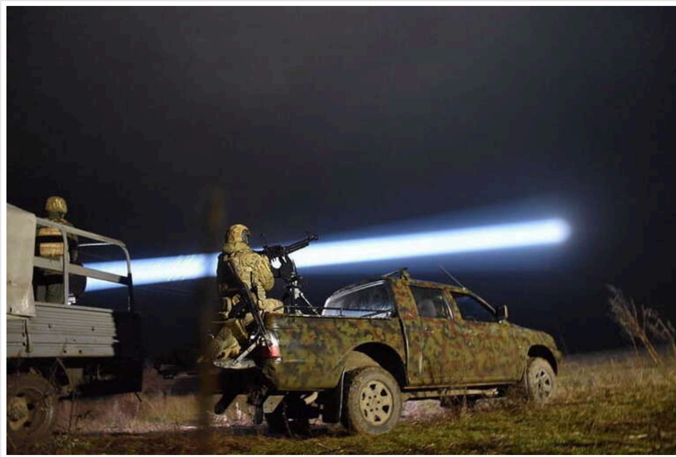
Сили ППО над Черкащиною збили 11 ворожих БПЛА

У небі над Черкащиною вночі українські захисники збили 11 «шахедів», обійшлося без постраждалих та руйнувань.