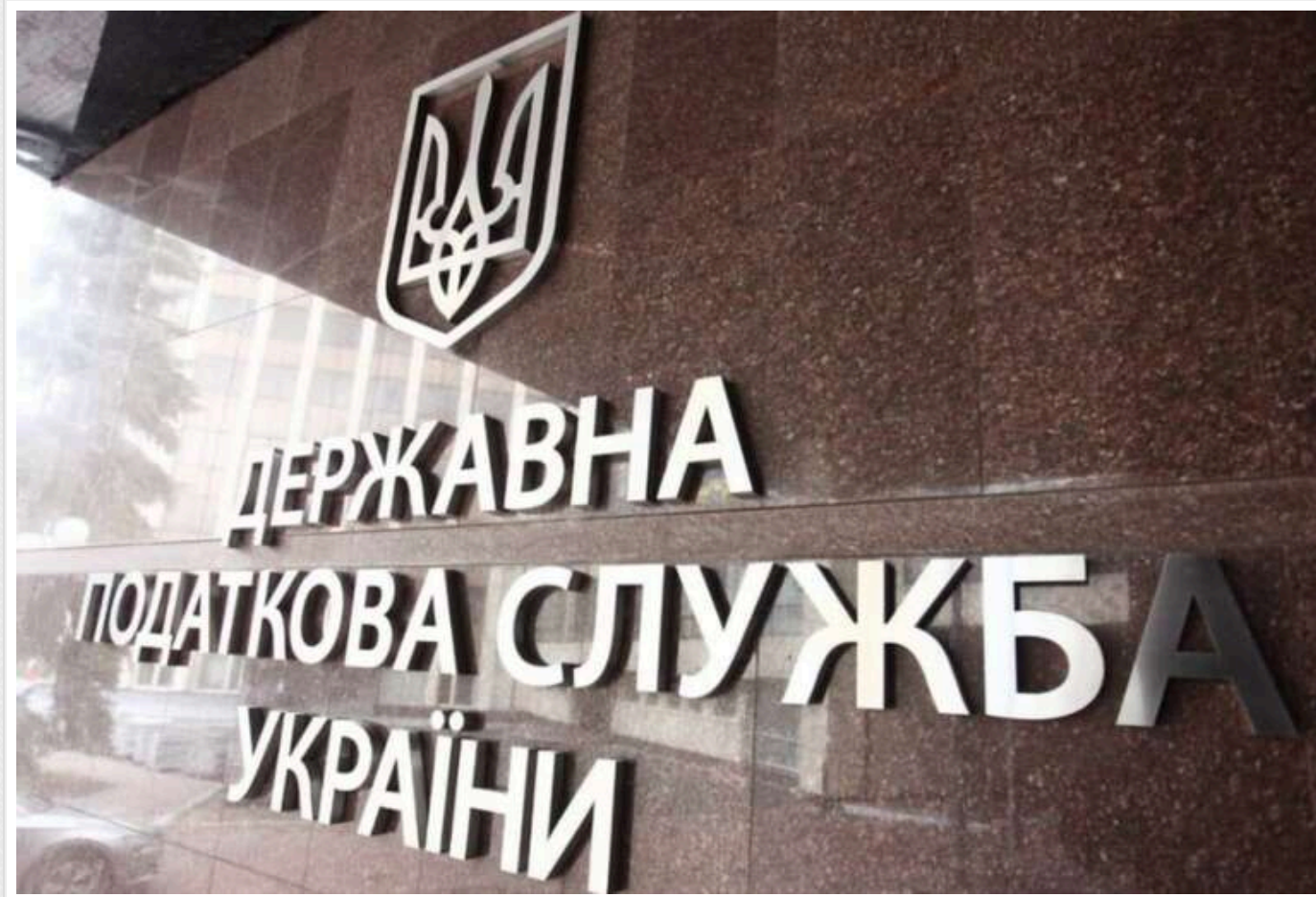
Керівництво податкової перевірили на наявність інвалідності, – нардеп

Керівництво Державної податкової служби перевірили на наявність оформленої інвалідності. Зі 17 осіб лише одна отримала інвалідність через поранення на фронті.