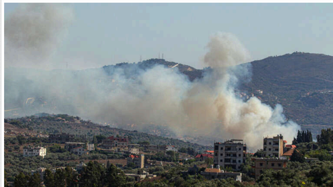
Al Jazeera інформує про загибель трьох журналістів внаслідок авіаудару по Лівану

Ізраїль завдав авіаудару по півдню Лівану на світанку, внаслідок чого загинули щонайменше троє журналістів.