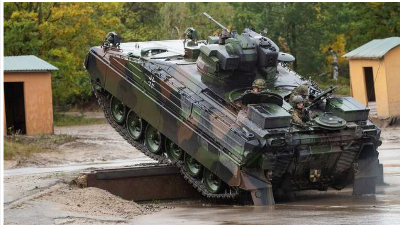
Україна отримала від Rheinmetall ще 20 БМП Marder

Німецька компанія Rheinmetall передала Україні ще 20 бойових машин піхоти Marder.