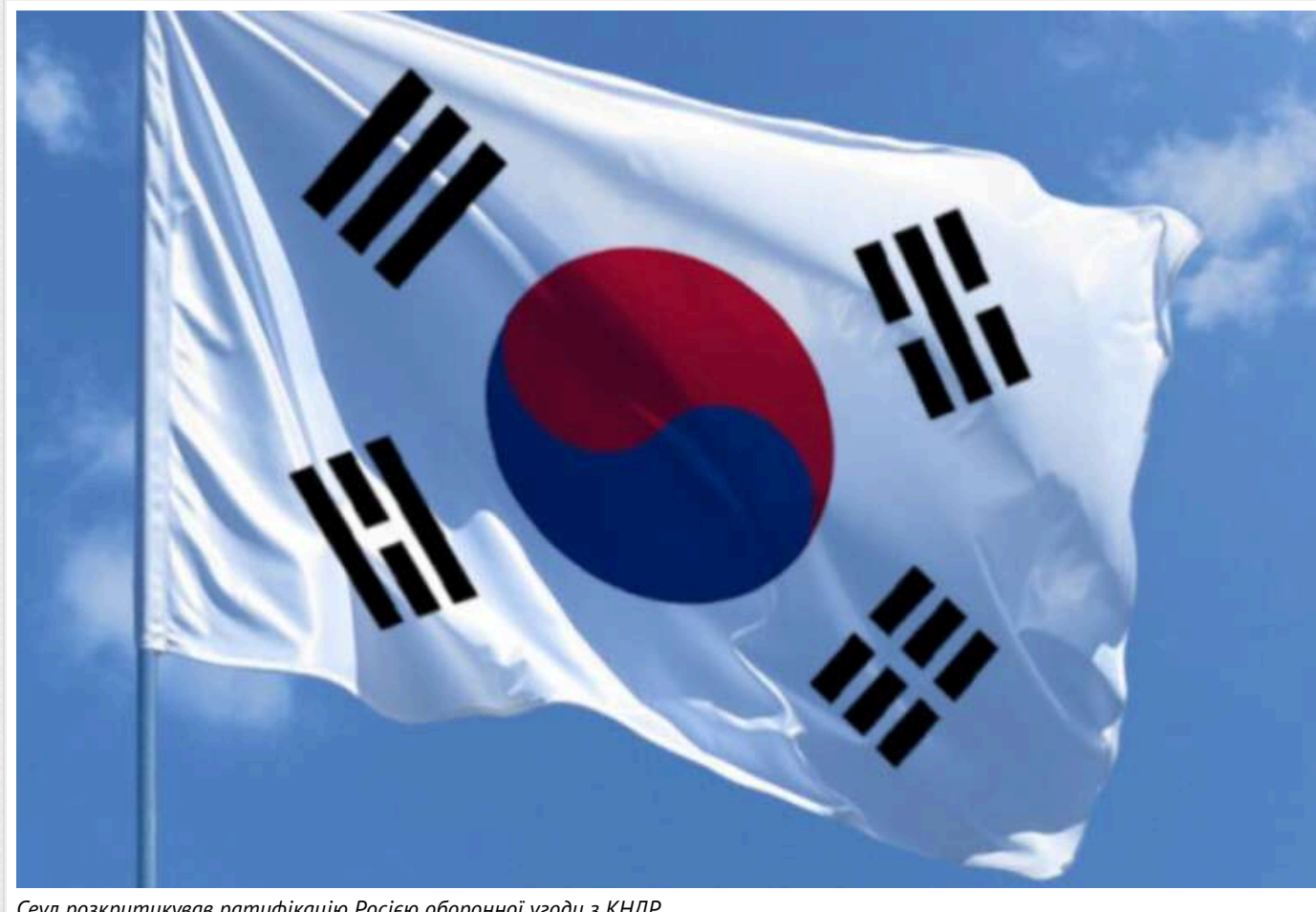
Сеул розкритикував ратифікацію Росією оборонної угоди з КНДР

Міністерство закордонних справ Південної Кореї висловило занепокоєння після ратифікації Росією оборонного договору з Північною Кореєю та закликло Москву зупинити «незаконну співпрацю» з Пхеньяном.