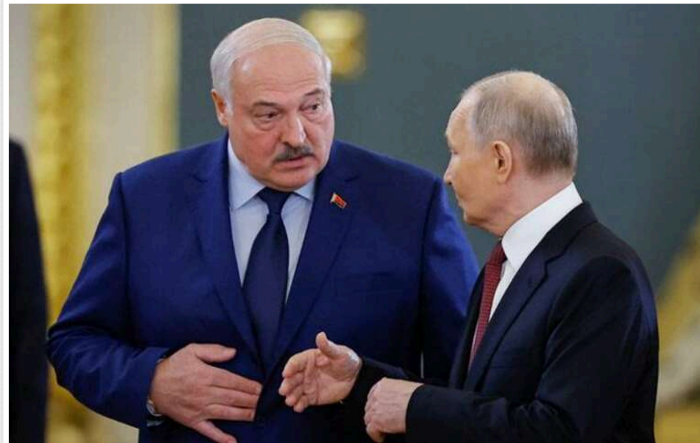
Спроба приєднати Білорусь до РФ обернеться для них війною, – Лукашенко

У "високих колах" Росії є ті, хто хоче приєднання Білорусі, але такі спроби призведуть до війни, попередив білоруський диктатор Олександр Лукашенко під час інтерв'ю росЗМІ.