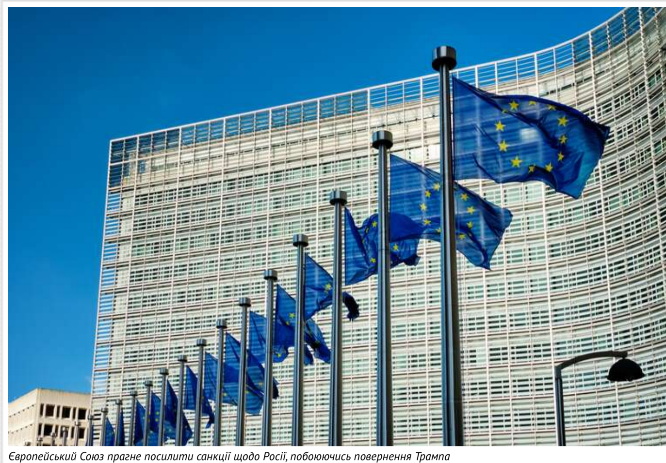
Європейський Союз прагне посилити санкції щодо Росії, побоюючись повернення Трампа

Європейські дипломати готуються змінити режим санкцій проти Росії, оскільки можливе повернення 45-го президента США від Республіканської партії Дональда Трампа може зірвати зусилля Заходу щодо ізоляції Москви.