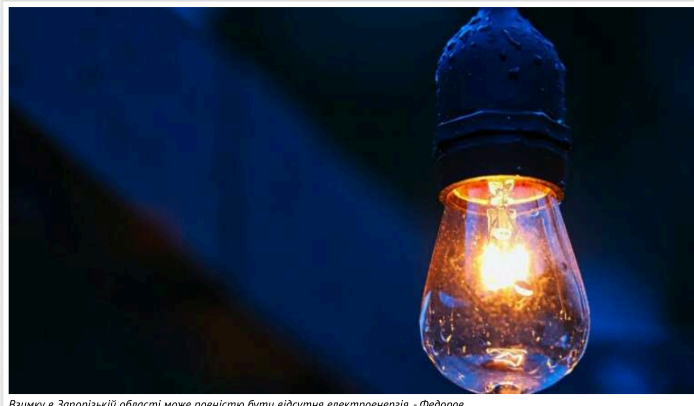
Взимку в Запорізькій області може повністю бути відсутня електроенергія, - Федоров