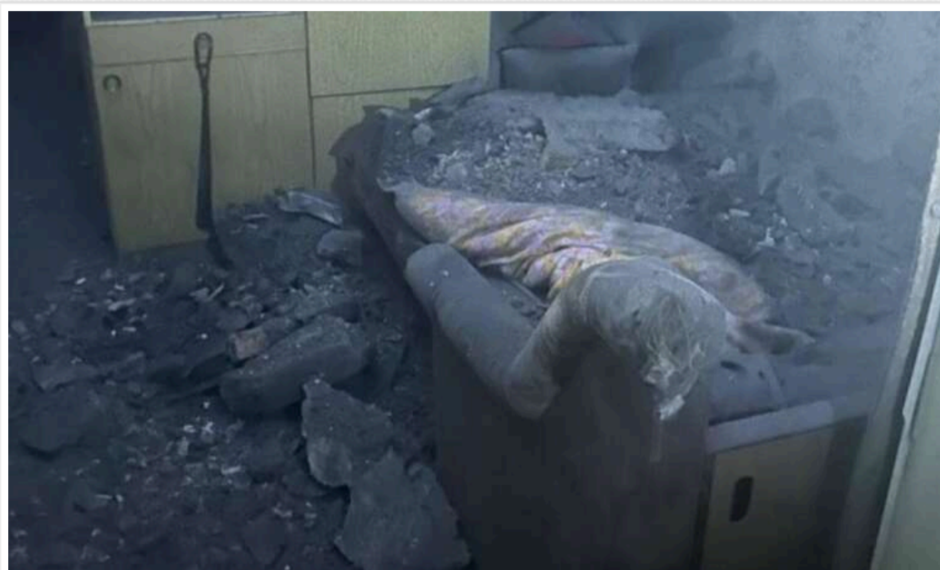
У Херсоні зранку снаряд потрапив у багатоквартирний будинок

У центрі Херсона показали наслідки ранкового обстрілу: один із російських снарядів влучив у дах житлового багатоповерхового будинку.