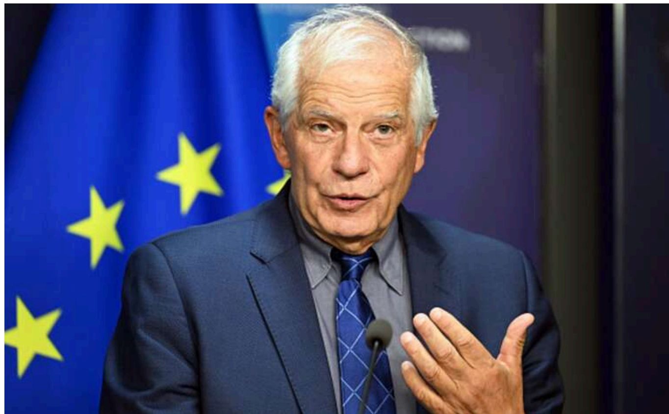
Боррель відреагував на відправку до РФ військ КНДР

Залучення військових Корейської Народно-Демократичної Республіки (КНДР) до війни проти України є одностороннім ворожим актом з боку Північної Кореї. Це також свідчить про те, що Російська Федерація (РФ) не готова до справедливого і довготривалого миру.