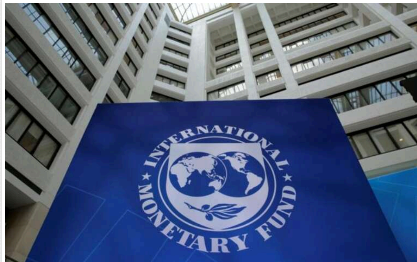
В МВФ визнали, що припустилися помилки в прогнозі щодо термінів завершення війни Росії проти України

Міжнародний валютний фонд змінив оцінку тривалості війни в Україні. Війна щонайменше до 2025 року негативно впливатиме і на Європу.