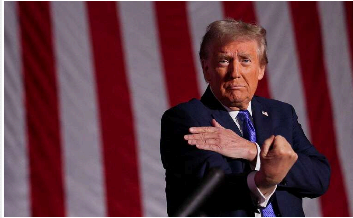
The Hill: На випадок перемоги Трампа республіканці готують план на перші 100 днів

Республіканці в Конгресі вже готують програму для Дональда Трампа на випадок його перемоги на президентських виборах. План дій розрахований на перші 100 днів його президентства.