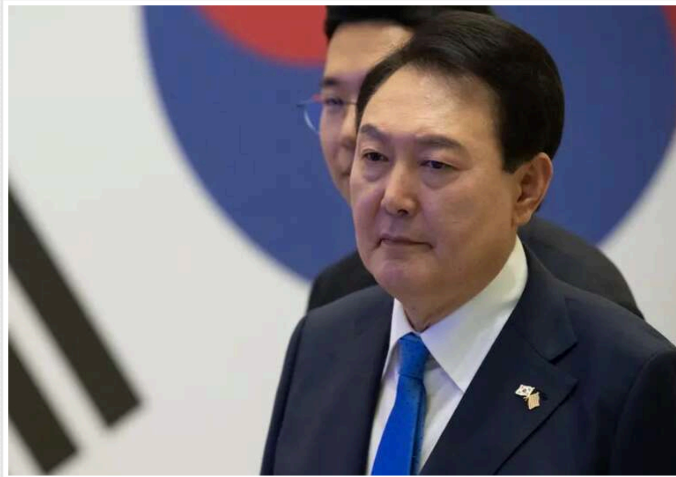
Президент Південної Кореї підтвердив, що через дії КНДР Сеул може розпочати постачання зброї Україні

Президент Південної Кореї Юн Сук Йоль оголосив про можливість постачання південнокорейської зброї Україні на тлі новин про прибуття військовослужбовців Північної Кореї до Росії для участі у війні на боці Москви.