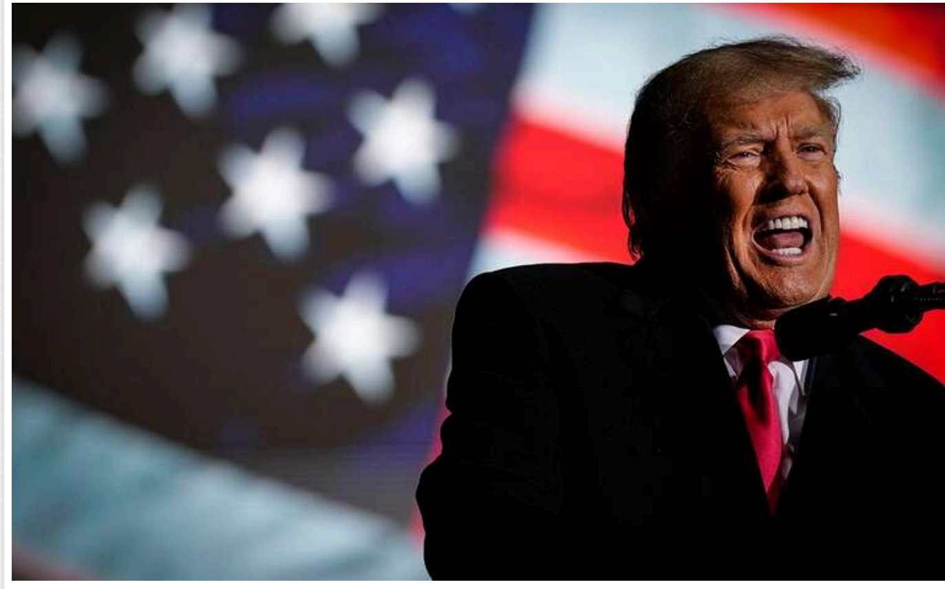
Трамп закликав "вигнати з країни" спецпрокурора, який розслідує справу проти нього

Кандидат у президенти США від Республіканської партії Дональд Трамп знову розкритикував спецпрокурора Міністерства юстиції Джека Сміта, який розслідує справу про його спроби змінити результати виборів 2020 року, і закликав "випровадити його з країни".