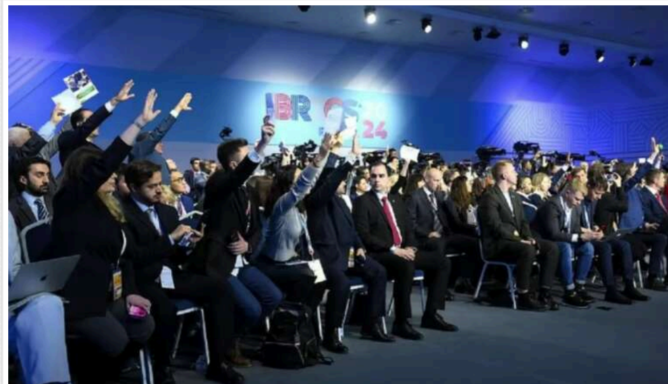
БРІКС трансформувався у величезну кампанію ботів і став настановою для пропагандистів, – ISW

Кремль намагається представити саміт БРІКС у Казані як свідчення широкої міжнародної підтримки Росії, особливо для внутрішньої аудиторії в Росії.