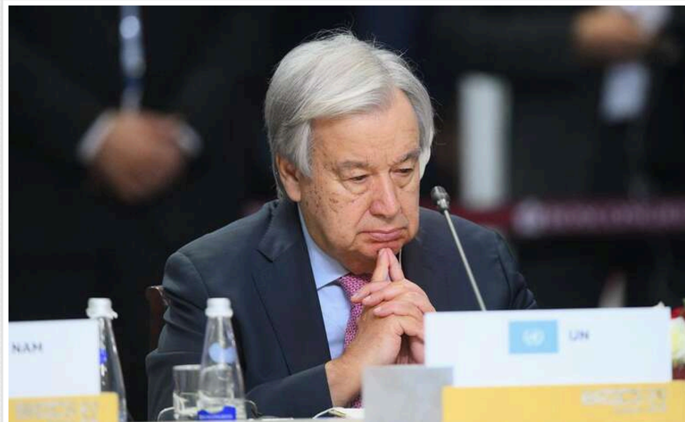
На саміті БРІКС Гутерріш заявив Путіну, що російське вторгнення в Україну є порушенням Статуту ООН

Антоніу Гутерріш під час останньої зустрічі з Володимиром Путіним підтвердив свою позицію про те, що вторгнення Росії в Україну є порушенням Статуту ООН і міжнародного права.