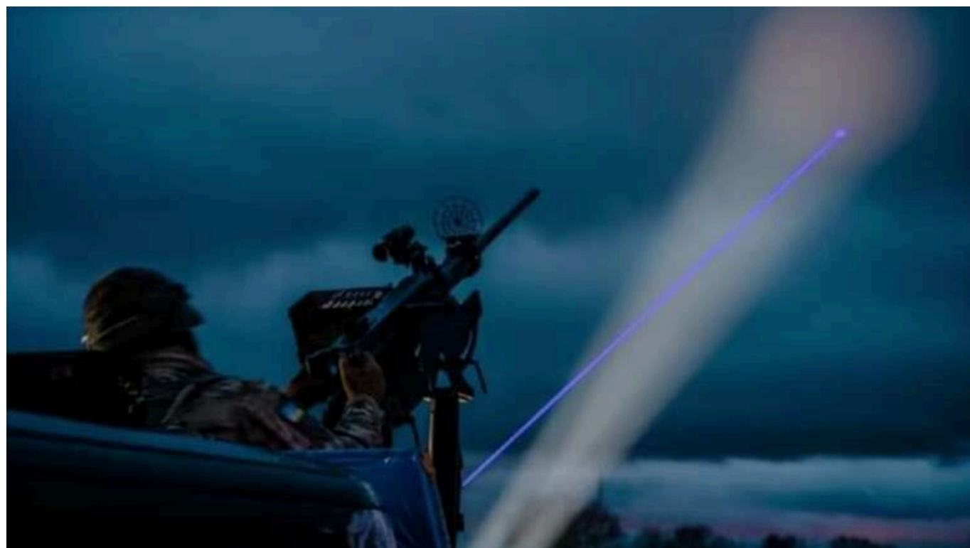
Вночі ворожі дрони атакували Львівщину: працювала ППО

Уночі в Львівській області під час атаки російських дронів працювала протиповітряна оборона.