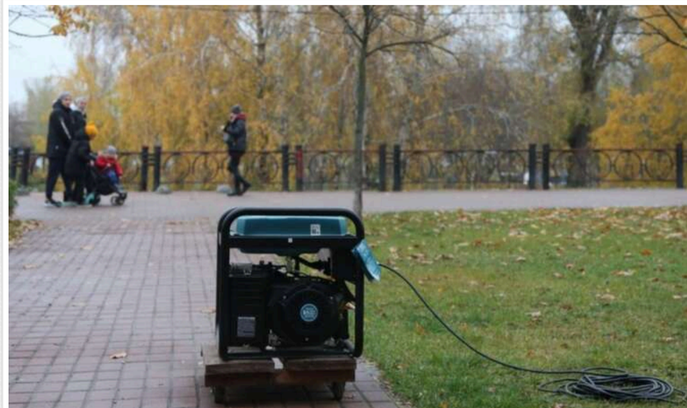
У столиці створять схему розміщення генераторів, — КМДА

У Києві може з'явитися схема розміщення генераторів через минулорічні скарги. Для цього планують спростити отримання дозволу на їх встановлення.