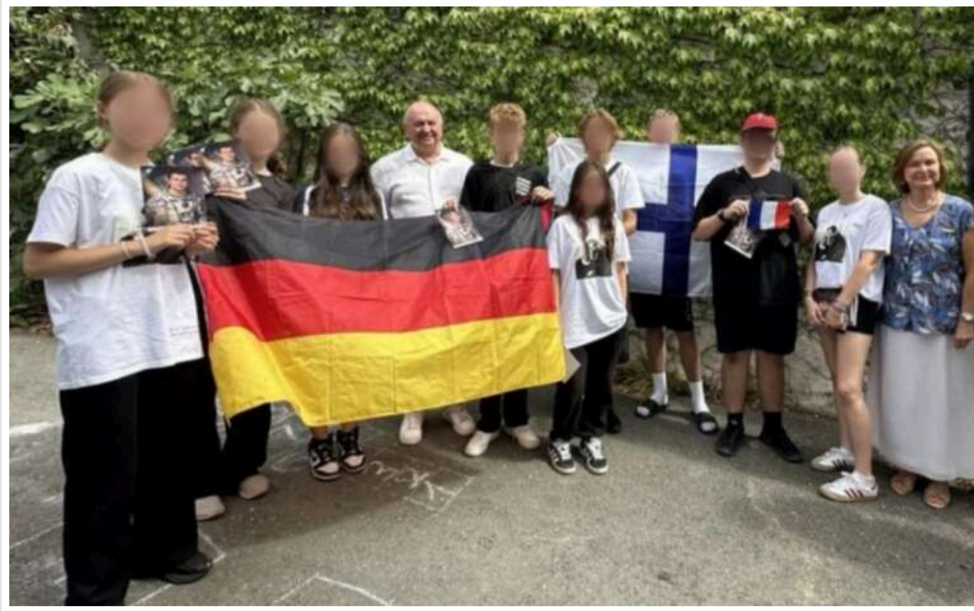
У кримському "Артеку" помітили дітей із ФРН

За інформацією від німецьких журналістів, крім спортивних та розважальних заходів, дітей залучали до пропагандистських акцій, знайомили з військовими РФ і нав'язували підтримку війни в Україні, а також лояльність до російських "традиційних цінностей".