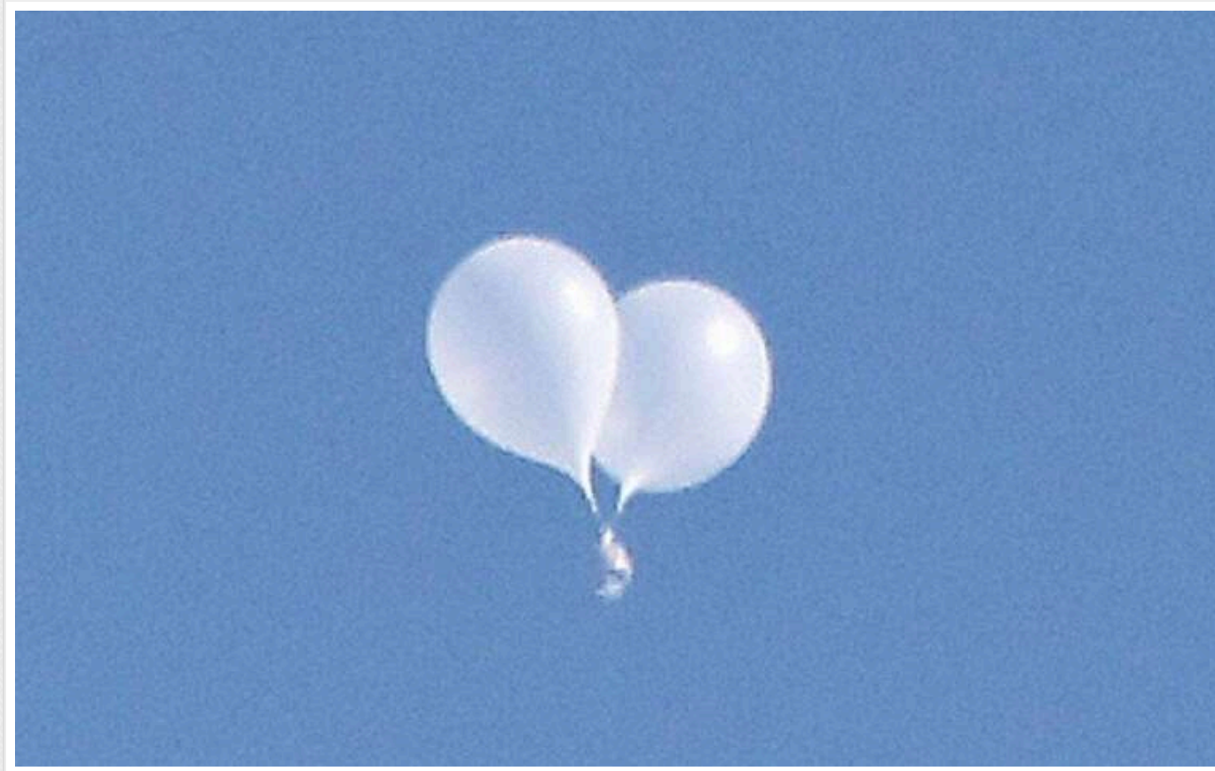
КНДР знову відправила 20 повітряних куль зі сміттям до Південної Кореї, – ЗМІ